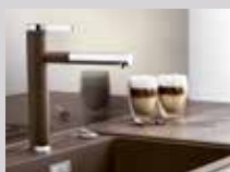
BLANCO LINEE-S: SILGRANIT™ farger.