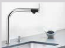
BLANCO VONDA farge: rustfritt stål eller krom.

Vi anbefaler BLANCO ANTIKALK for fjerning av vanskelig flekker og merker. Middelet er spesielt utviklet for BLANCO blandebatterier og vasker, renser grundig men er samtidig skånsom mot alle overflater.