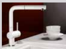
BLANCO LINUS-S: keramiske porselens- farger.